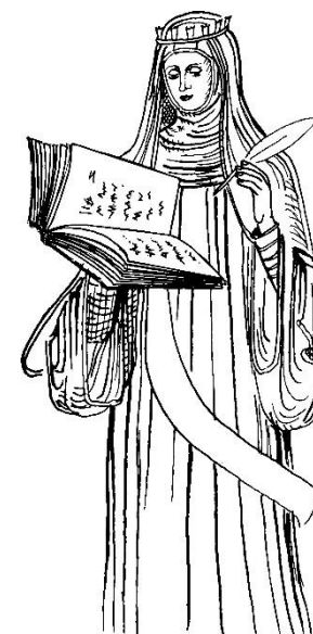
Hildegard von Bingen